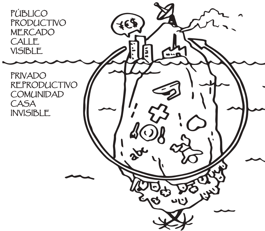
Figura 2: El iceberg